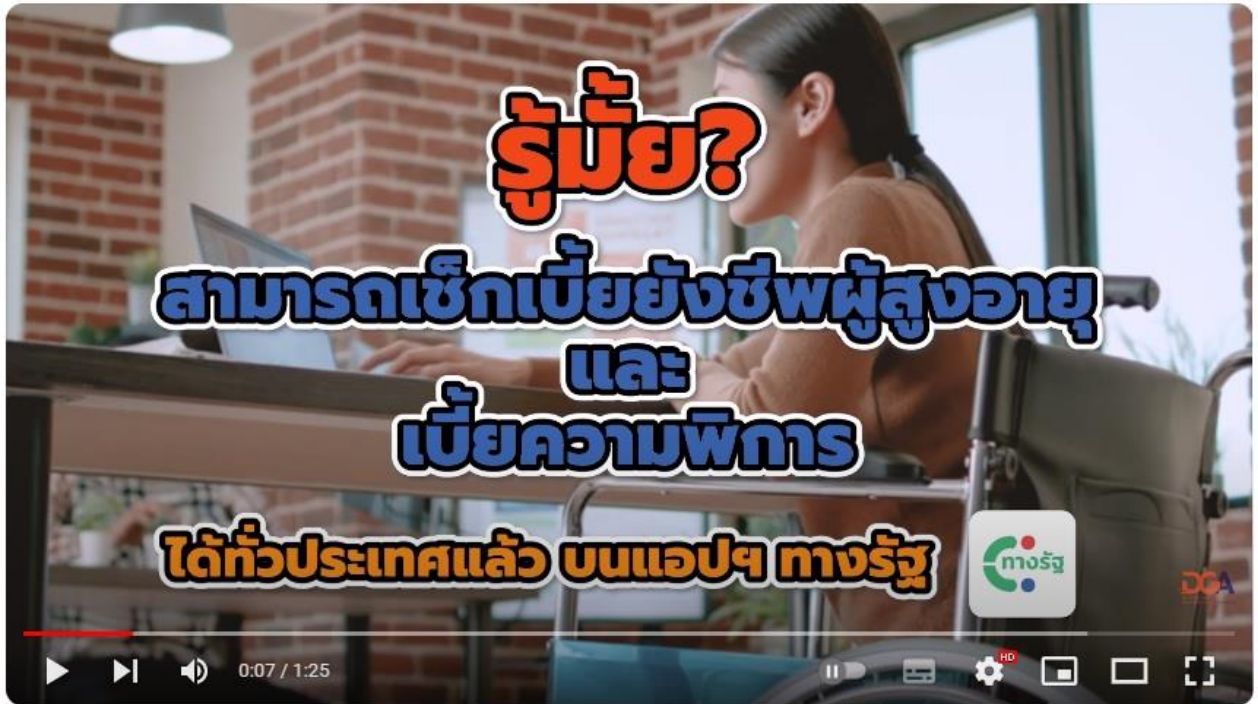
เช็กเบี้ยยังชีพผู้สูงอายุ และ เบี้ยความพิการ ได้ทั่วประเทศบนแอปฯ “ทางรัฐ”

เช็กเบี้ยยังชีพผู้สูงอายุ และเบี้ยความพิการ ได้ทั่วประเทศบนแอปฯ “ทางรัฐ” รับชมคลิปวิดีโอได้ที่ https://www.youtube.com/watch?v=bc89fWGj9qA